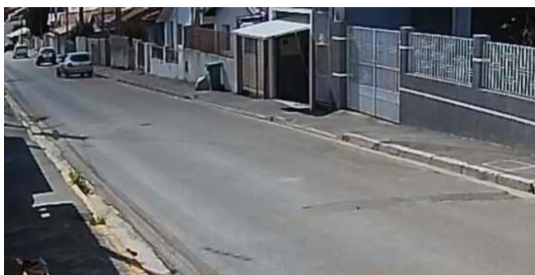
A dupla voltava à Buri após tentar vender o carro em Itapetininga.

Campina do Monte Alegre já havia sido informada do caso pela Guarda Municipal de Buri. Ao passar pela cidade, o automóvel não atendeu a ordem de parada