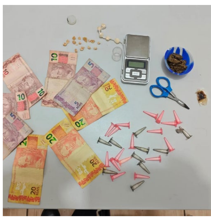
O Delegado de Plantão determinou que as drogas, objetos e valores foram apresentados e devidamente apreendidos.

No último final de semana, uma equipe de Rádio Patrulha da Guarda Civil Municipal de Itapeva realizava Policiamento Preventivo na Vila Dom Bosco e Vila Mariana, momento em que ingressaram na travessa 1, local conhecido pela mercancia de entorpecentes, ouviram que pessoas associadas ao tráfico anunciavam a chegada da Equipe Policial. Sendo assim, aqueles que estavam na venda de drogas saíram correndo, não sendo possível alcançá-los, porém deixaram para trás diversas porções de entorpecentes e objetos, 49 porções de drogas diversas, uma balança de precisão e R$ 100 em dinheiro. Tudo foi recolhido e apresentado no Plantão Policial, onde